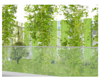
Blick von Wohneinheit / Balkon Store Effekt