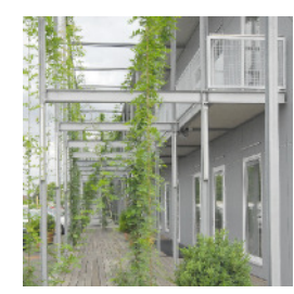
Referenzbilder Wohnpark Eybesfeld