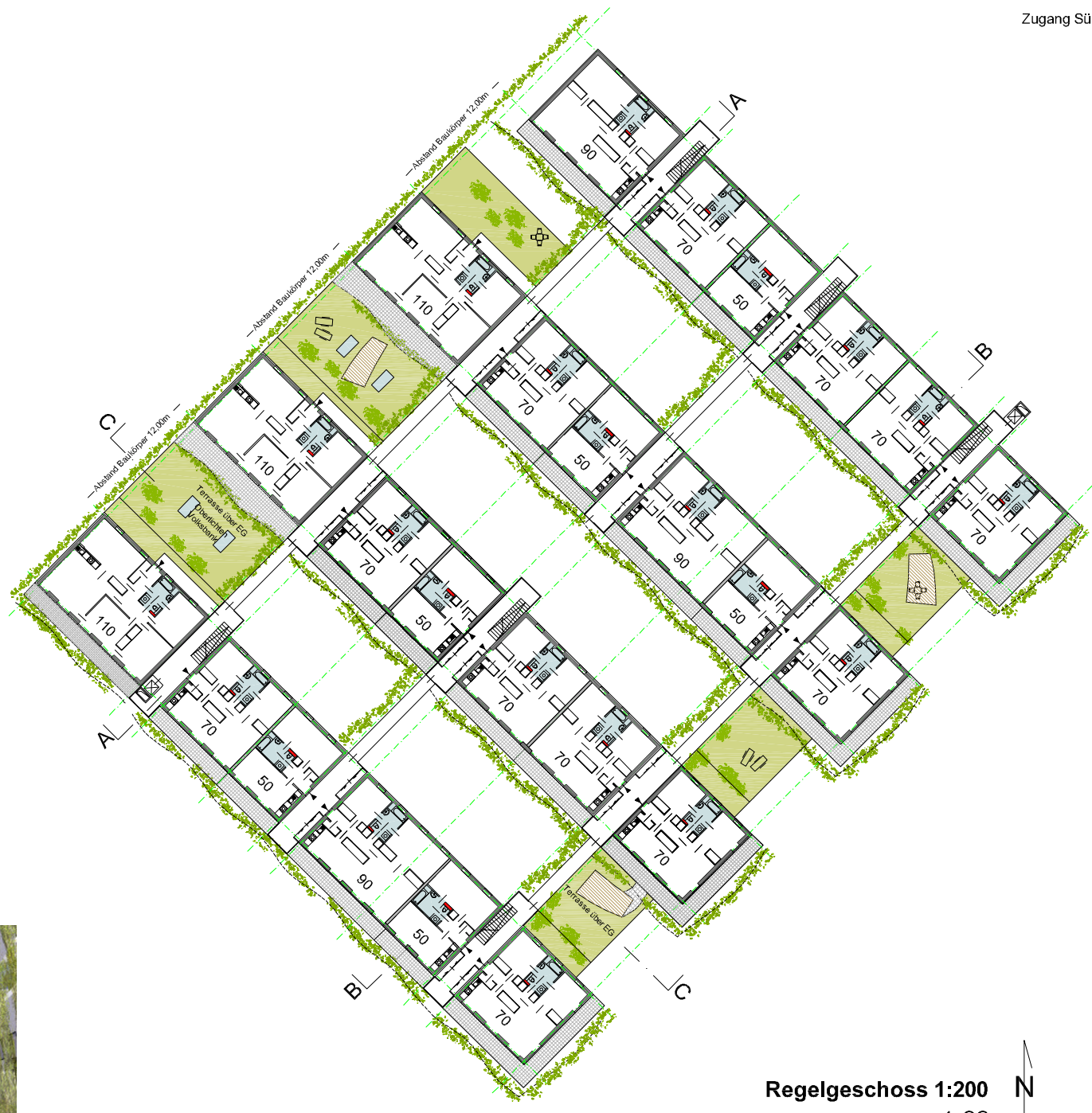
Regelgeschoss 1:200 1. OG