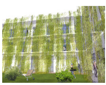
Atrium mit Balkonen und Erschließung